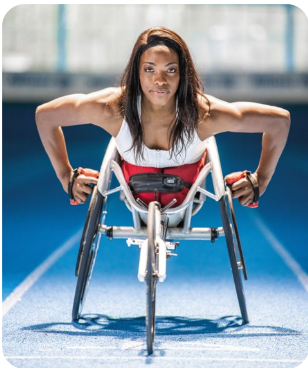
La campagne «Handisport au féminin» de la Ligue francophone Handisport

terrain... La Commission voit donc d'un bon œil ces démarches nécessaires pour donner du sens au programme d'actions et, le cas échéant, pour lui donner de nouvelles orientations.